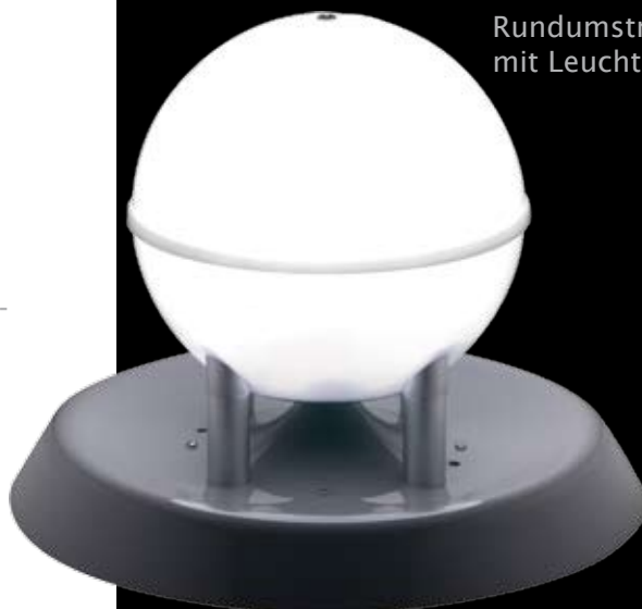
Rundumstrahler mit Leuchte