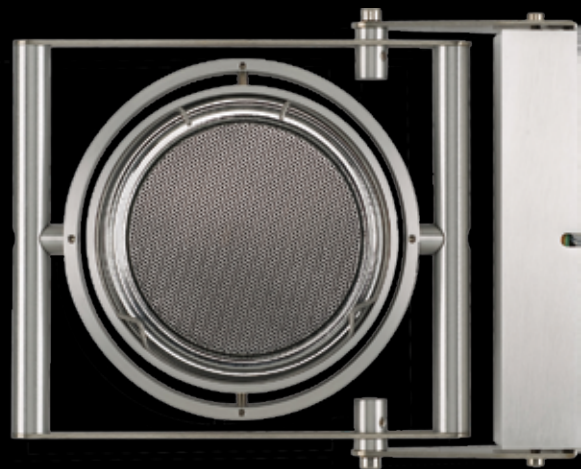
Edelstahllautsprecher mit Kardangelenk